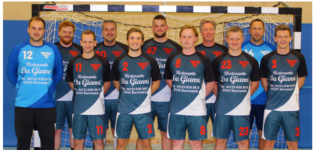
Die erfolgreiche erste Herrenmannschaft des BMTV.

Die Mannschaft will aus einer stabilen Deckung mit Tempo nach vorne spielen, und so seine Gegner überraschen. Unter dem Motto „Lass die Ritterspiele beginnen“ will das BMTV-Team die Mission Klassenerhalt angehen. Der Bezug auf das Barmstedter Stadtwappen ist nicht zufällig gewählt. Die Barmstedter Zuschauer sollen nicht enttäuscht werden: Auch wenn es spielerisch mal nicht läuft, will